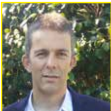
Presidente: Esteban Bacelo Souto